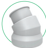
Bocal giratório para mangueira de 2,5"