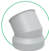
Bocal giratório para mangueira de 3"